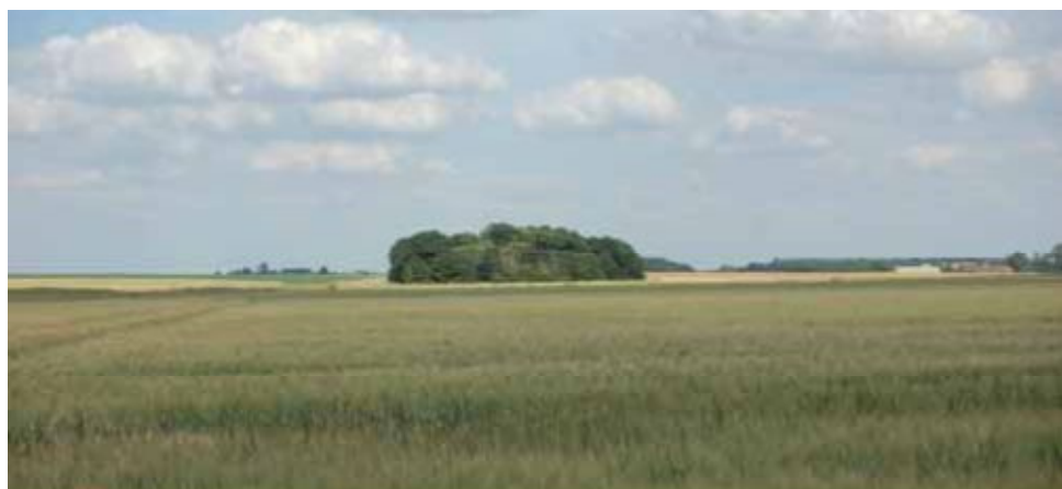
Bosquet en Beauce

Les bosquets, boqueteaux et buissons présentent un intérêt floristique dès l'implantation en fonction de la diversité des espèces implantées et des strates végétales favorisées. Avec le temps d'autres espèces s'installent (fleurs sauvages, lianes...) et augmentent la diversité floristique de l'aménagement et donc son intérêt.